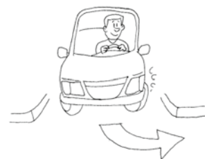
Illustration: © Hueber Verlag, München / Antoni Nadir Cherif