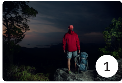
am Abend wandern

machen • spielen • besuchen • lesen • surfen • joggen • basteln • fotografieren • wandern • laufen