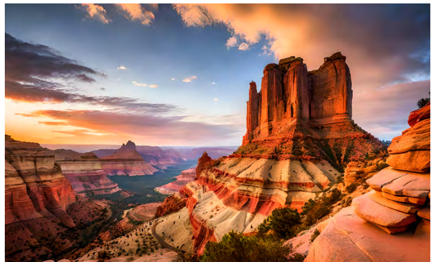
Ⓑ echt Fake