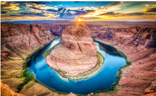
Ⓐ echt Fake

d Welches der beiden Bilder ist echt, welches ist Fake?